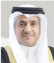
وزير المواصلات والاتصالات

في فبراير 2016 بتكلفته إجمالية تبلغ 1.1 مليار دولار أمريكي، ويمتد على مساحة 210 ألف متر مربع وبطاقة استيعابية تصل إلى 14 مليون مسافر و130 ألف حركة جوية للطائرات سنوياً ومناولة 4,800 حقيبة في الساعة، إلى جانب ذلك كله، يضم موقف للسيارات متعدد الطوابق بمساحة تقارب 27,000 متر مربع وبمساحة إجمالية تصل إلى 2,700 سيارة.