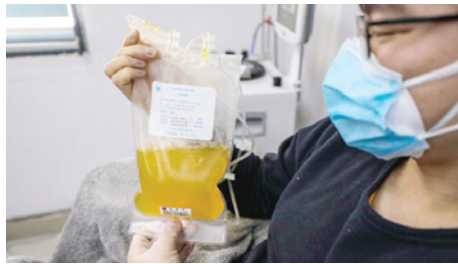
الطبيب يحاولون استخدام الأجسام المضادة في البلازما لمعالجة أعراض «كورونا»

يتوجب اتباع الطريقة العلمية في البحث، حيث يتوجب اختبار عدد من المرضى يتم توزيعهم إلى مجموعتين، الأولى تحقن بالمصل «بالإضافة إلى العلاج المعتمد»، والثانية تحصل على العلاج المعتمد فقط، ومن ثم تتم مقارنة نتائج التجربة للتأكد من تأثير المصل وهل كان له دور في تقليل فترة أو ضراوة المرض أو حصل تحسن في المؤشرات الإكلينيكية؟ وربما يكون التأثير الأكبر في المرضى الذين حالتهم حرجة مثل كبار السن والمرضى المصابين بالأمراض المزمنة».