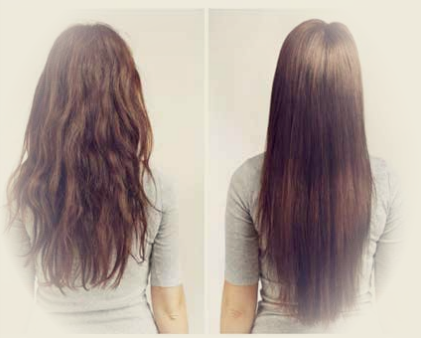
الكيراتين يساهم في فرد الشعر

وأشارت الريفي، إلى عدم وجود دراسات بحرينية أو خليجية لحد الآن حول هذا الموضوع، مؤكدة ارتفاع نسب الإصابة بسرطان الثدي في البحرين خلال الستين الخمس