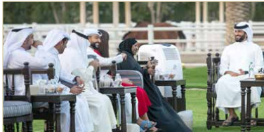
سمو ناصر بن حمد يسبق بفرق عمل برنامج السارية

◆ ناصر بن حمد: الإعلام شريك أساس في ترسيخ الهوية